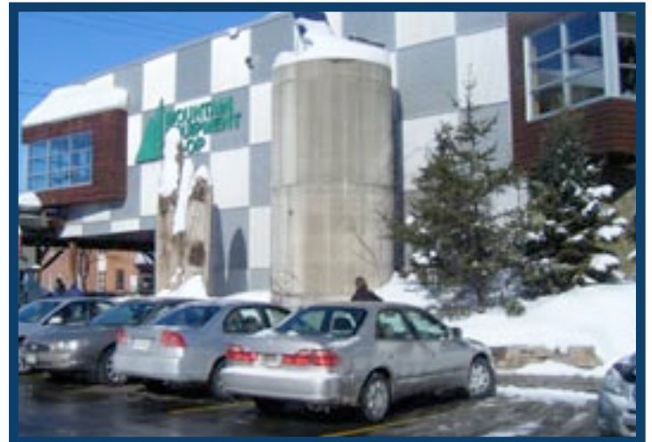
Los asistentes al congreso de ACE Institute tendrán la posibilidad de visitar Mountain Equipment Co-operative, uno de los líderes canadienses en materia de sostenibilidad.

El apoyo a la juventud será un aspecto fundamental que se tratará en las sesiones y los talleres del último día y los colaboradores más jóvenes expresarán su capacidad para integrarse en las cooperativas actuales, así como sus deseos de encarar nuevos emprendimientos. Los asistentes también tendrán la oportunidad de aprender unos de otros y conocer las investigaciones que se realizan en las cooperativas y mutuales crediticias. El congreso finalizará con una serie de consejos muy prácticos y un conjunto de herramientas para ayudar a los asistentes a reconocer prácticas sustentables en sus lugares de trabajo.