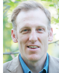
University of Wisconsin CENTER FOR COOPERATIVES

la India y América Central. Continuó para completar su Maestría en Humanidades y su Doctorado con especialización en Sociología en la Boston College, en donde estudió cooperativas de trabajadores y titularidad de los empleados. Realizó su investigación doctoral sobre la gestión de la Corporación Mondragón.